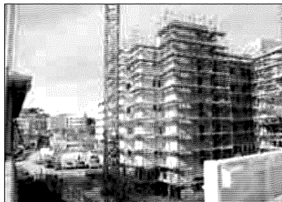
Un cantiere delle Palombara